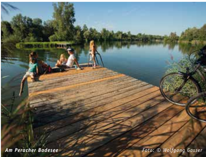
Am Peracher Badeseesee