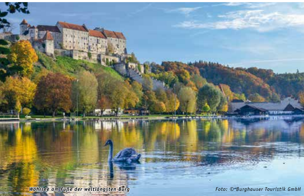
Wöhrsee am Fuße der weltlängsten Burg