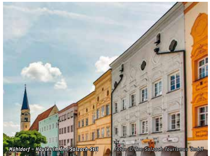
Mühldorf – Häuser im Inn-Salzach-Stil