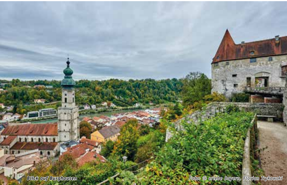
Blick auf Burghausen