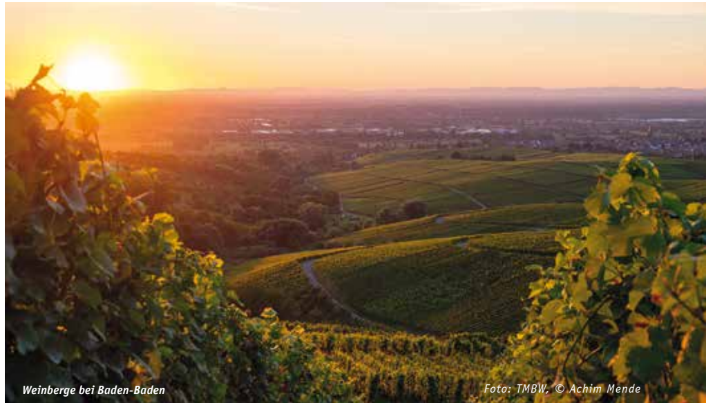
Weinberge bei Baden-Baden

Das Angebot der Sportschule für Schulklassen beinhaltet die Unterbringung in Doppel- oder Mehrbettzimmern, die Nutzung der Sportstätten sowie eines Lehrsaales und Vollverpflegung. Die Lehrer sind in Einzelzimmern im gleichen Haus wie ihre Schüler untergebracht. „Unsere Unter-