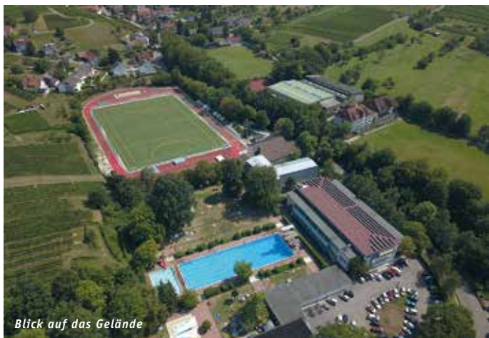
Blick auf das Gelände

Möglichkeiten für zahlreiche Sportarten, Freizeitspaß und Unterkünfte bietet die Sportschule Baden-Baden Steinbach auch für Schulklassen