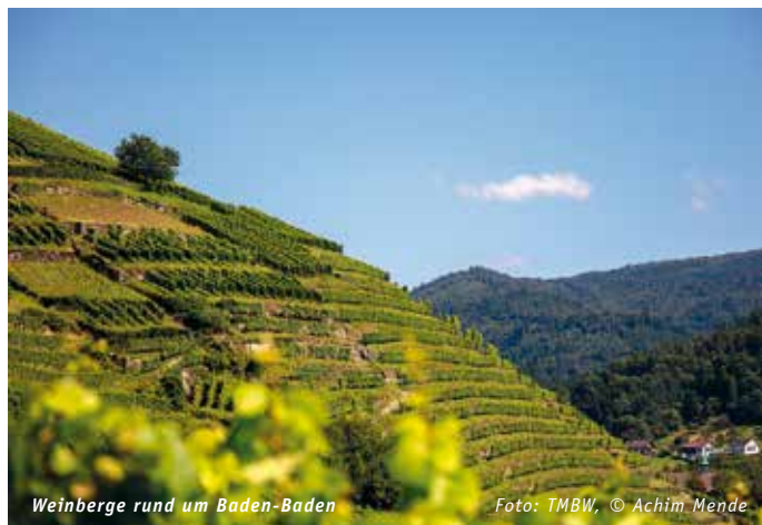
Weinberge rund um Baden-Baden