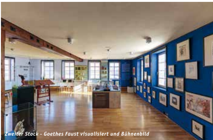
Zweiter Stock - Goethes Faust visualisiert und Bühnenbild