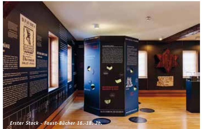
Erster Stock - Faust-Bücher 16.-18. Jh.