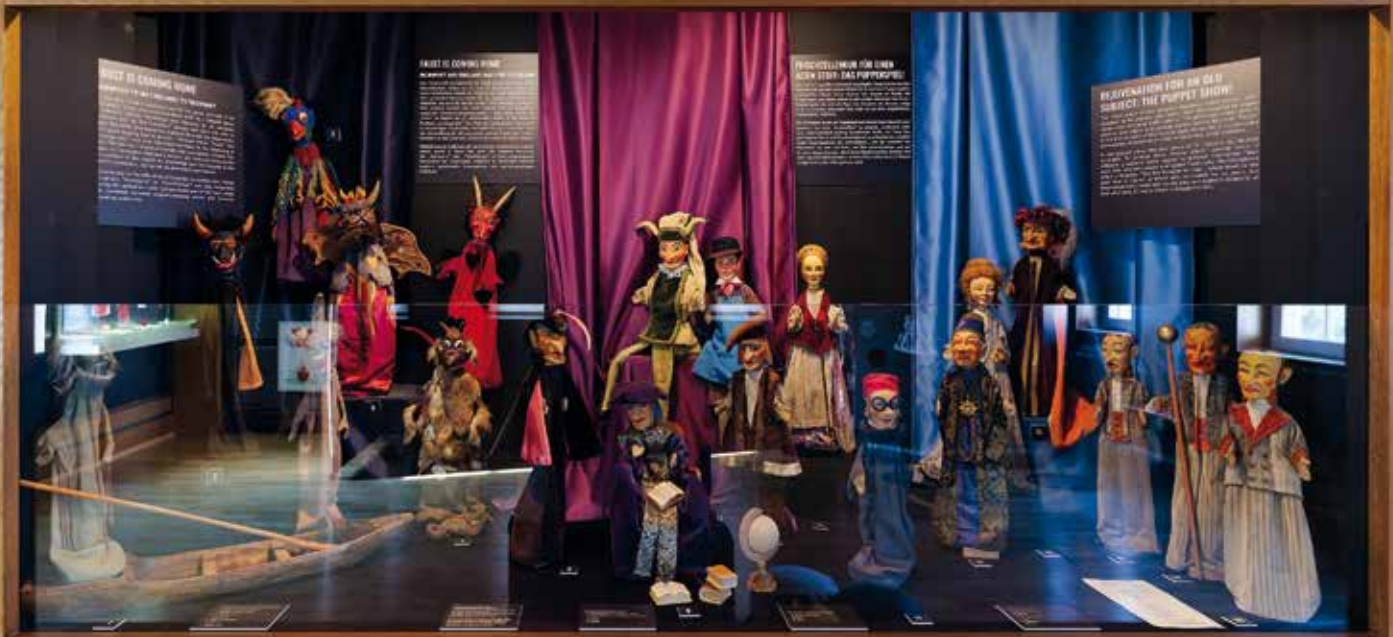
Das Puppenspiel vom Doktor Faust - Puppentheater Hohnsteiner

in die Welt der Renaissance und kann sich im Umrunden eines Zentralpodestes mit den Quellen zur historischen Faust-Gestalt nicht nur dessen Leben ‚erlaufen‘, sondern auch die Einordnung in die Weltgeschichte mit all ihren Repräsentanten der kultur- und gesellschaftsgeschichtlichen Strömungen und Entwicklungen nachvollziehen“, berichtet die Museumsleiterin.