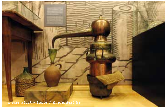
Erster Stock - Labor / Kupferdestille

Johann Georg Faust, ein wandernder Wunderheiler, Alchemist, Magier, Astrologe und Wahrsager, soll vor etwa 500 Jahren in Knittlingen gelebt haben und schied bei einer Explosion aus dem Leben. Er wurde zu einer faszinierenden Figur der Kulturgeschichte.