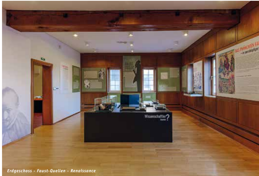
Erdgeschoss - Faust-Quellen - Renaissance